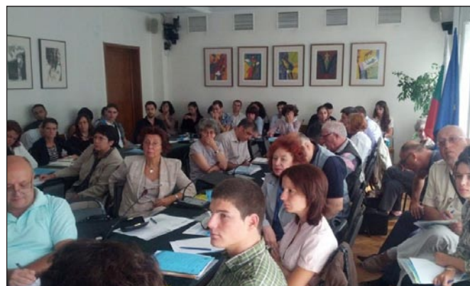
Семинар за предприемачи