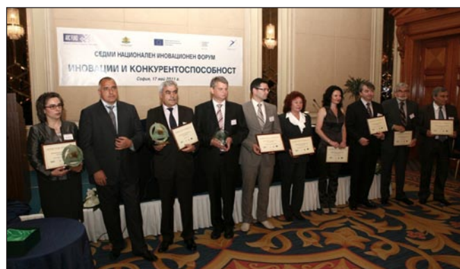
Седми конкурс за иновативно предприятие на годината

Източник: По данни на Enterprise Europe Network, 2012.